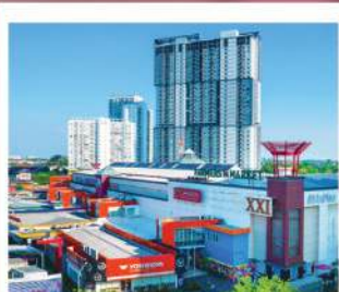
Plaza Bintaro Jaya