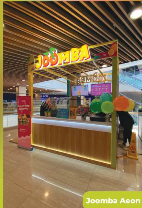
Joomba Aeon Mall Sentul