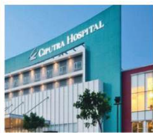
RS Citra Raya Tangerang