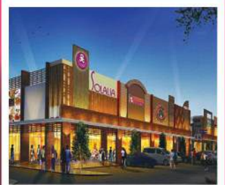
Grand Kota Bintang Bekasi