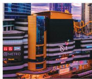
Trans Studio Mall Cibubur