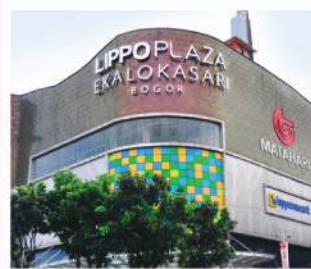
Lippo Plaza Ekalokasari Bogor