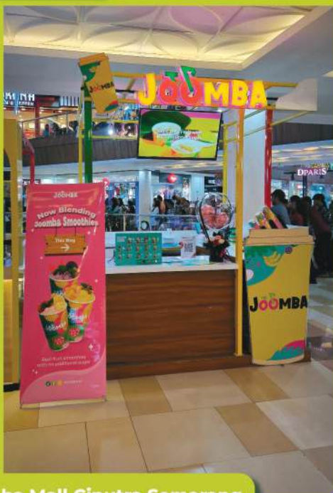
Joomba Mall Ciputra Semarang