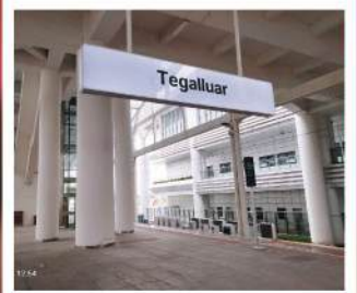
Stasiun Whoosh Tegalluar