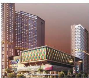
Trans Park Mall Bintaro