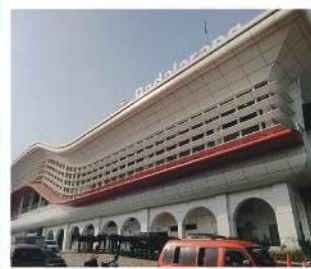
Stasiun Whoosh Padalarang