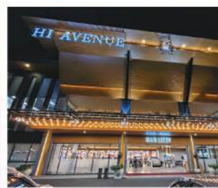
HI Avenue (Harapan Indah Bekasi)