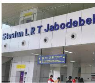
Stasiun LRT Halim