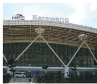
Stasiun Whoosh Karawang