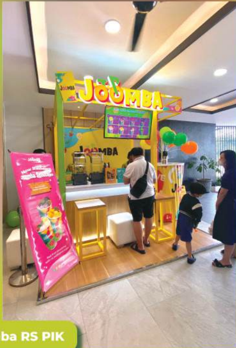
Joomba RS PIK