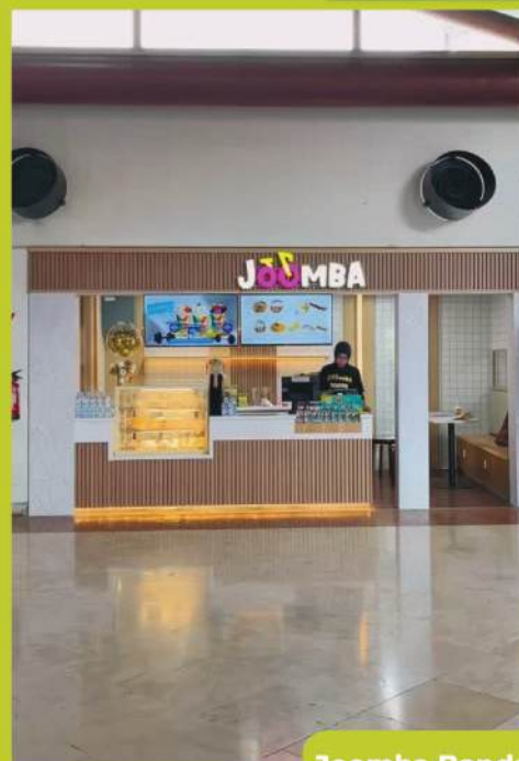
Joomba Bandara Soekarno Hatta