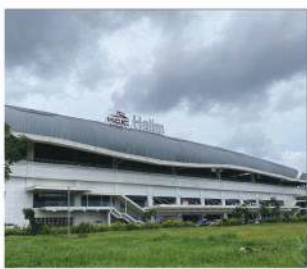
Stasiun Whoosh Halim