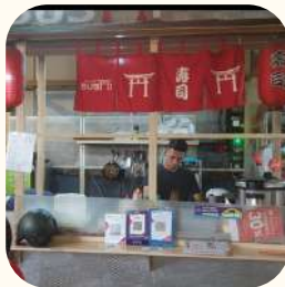
2022 Tanjung Barat