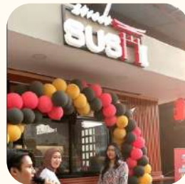
2023 Tengah Palmerah