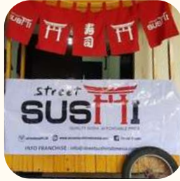
2020 Andir, Bandung