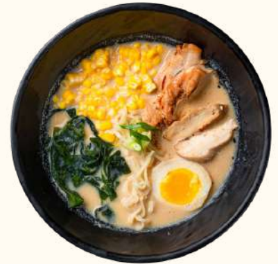
CHICKEN MISO RAMEN