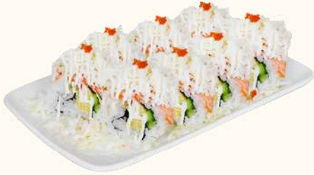
CHEESY SALMON ROLL