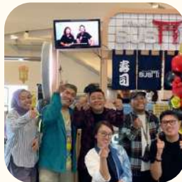
2023 Gandaria City