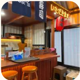
2023 Tengah Cijantung