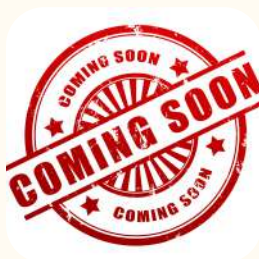
2024 Palagan Jogja