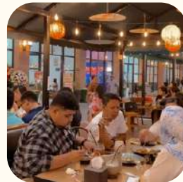
2023 Citra 8