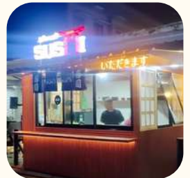
2023 Condet Park