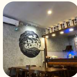
2024 Gejayan Jogja