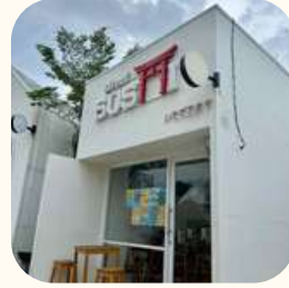
2023 Tabebuia Park