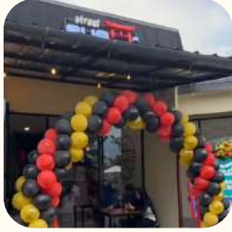
2023 Cibis Park