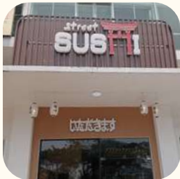
2023 Gading Serpong