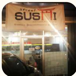
2022 Tanjung Duren