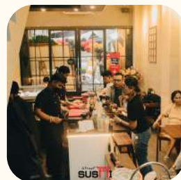
2022 Grand Galaxy