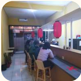
2020 KSU Depok