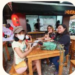
2022 Kebayoran Lama