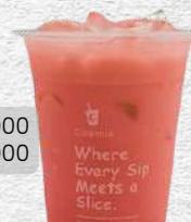
LYCHEE TEA- COLD