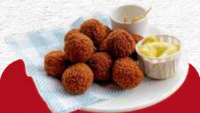
BITTER BALEN BRULEE BOOM