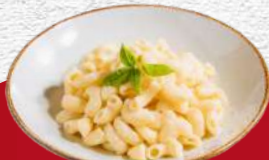
MAC & CHEESE